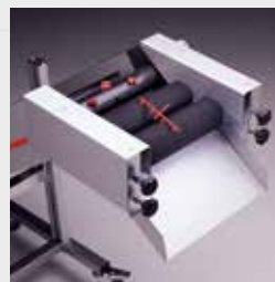
SRS - SRD - SRT Separatore a rullo semplice, doppio e triplo Simple roller separator, Double and Triple