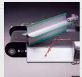
SP Separatore a palette Paddle separator